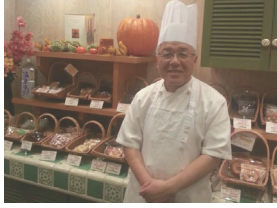
《彩春》 《Mater's Cafe》 《pecoli kitchen》